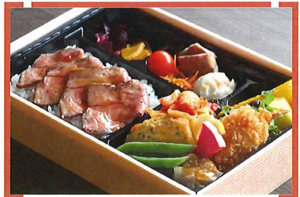
赤城牛ローストビーフBBQソース