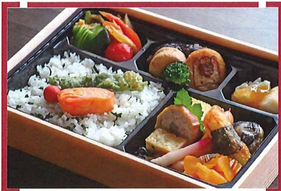
幕の内弁当 雅<みやび>