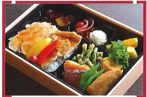
ポーク&チキンオリエンタル(照焼き)