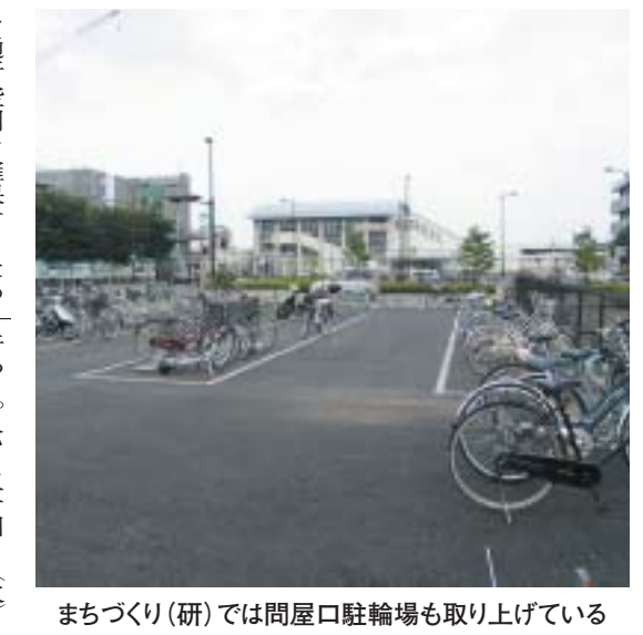
まちづくり(研)では問屋口駐輪場も取り上げている

高崎市(都市計画課)では、高崎問屋町駅周辺の放免自転車利用者の安全で快適な通行空間を確保するため、問屋町四丁目四の問屋町駐輪場(旧・問屋町バレーコート)で、広さは一〇五〇㎡、約六百台収容のもの。この駐輪場建設は、高崎市の都市計画の一環として行われる。七月二十四日(火)に問屋街センター会議室において地元説明会が行われた。八月二十七日(月)午前十時より問屋街センター会議室において公開説明会が行われる。その後、計画縦覧や改革都市計画審議会での審議、県知事の同意を経て、今年度中には着工完成される見通しである。