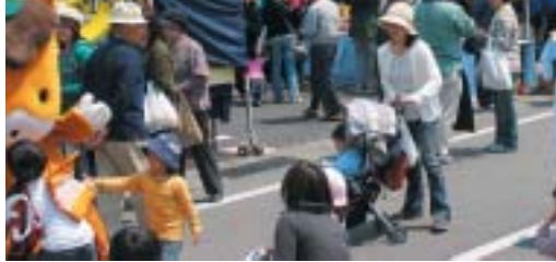
毎回3万人前後の方が来場する上州どっと楽市

を募っている。ただし、飲食関係の出店者は、食品衛生責任者資格や食品営業許可が条件である。 出店料は、基本出店料三万円と小間料や備品代等。八月二十五日(土)締切りである。どっと楽市実行委員会での審査委員会において出店審査を行い、出店を決定する。詳しくは、どっと楽市実行委員会まで。