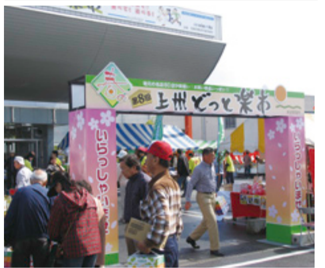
初日の雨にもかかわらず2日間で25,000人が来場した春の楽市