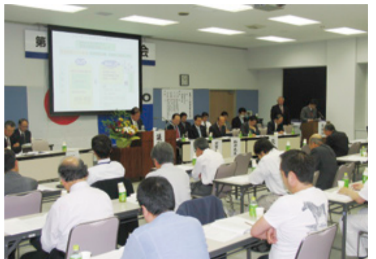
5月21日に行われた組合通常総会。資料はプロジェクターで投影された。