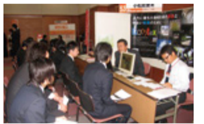
問屋街各社のブースも大人気