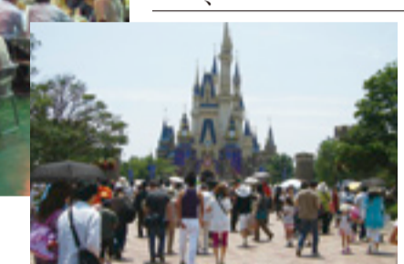
毎週開催のハイキング・ゴルフは秋に